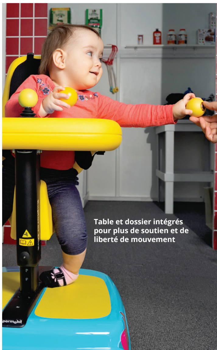
Table et dossier intégrés pour plus de soutien et de liberté de mouvement