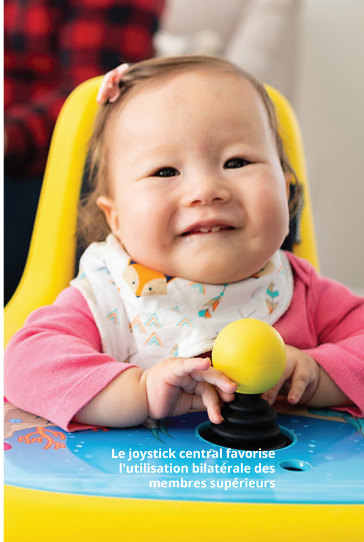
Le joystick central favorise l'utilisation bilatérale des membres supérieurs