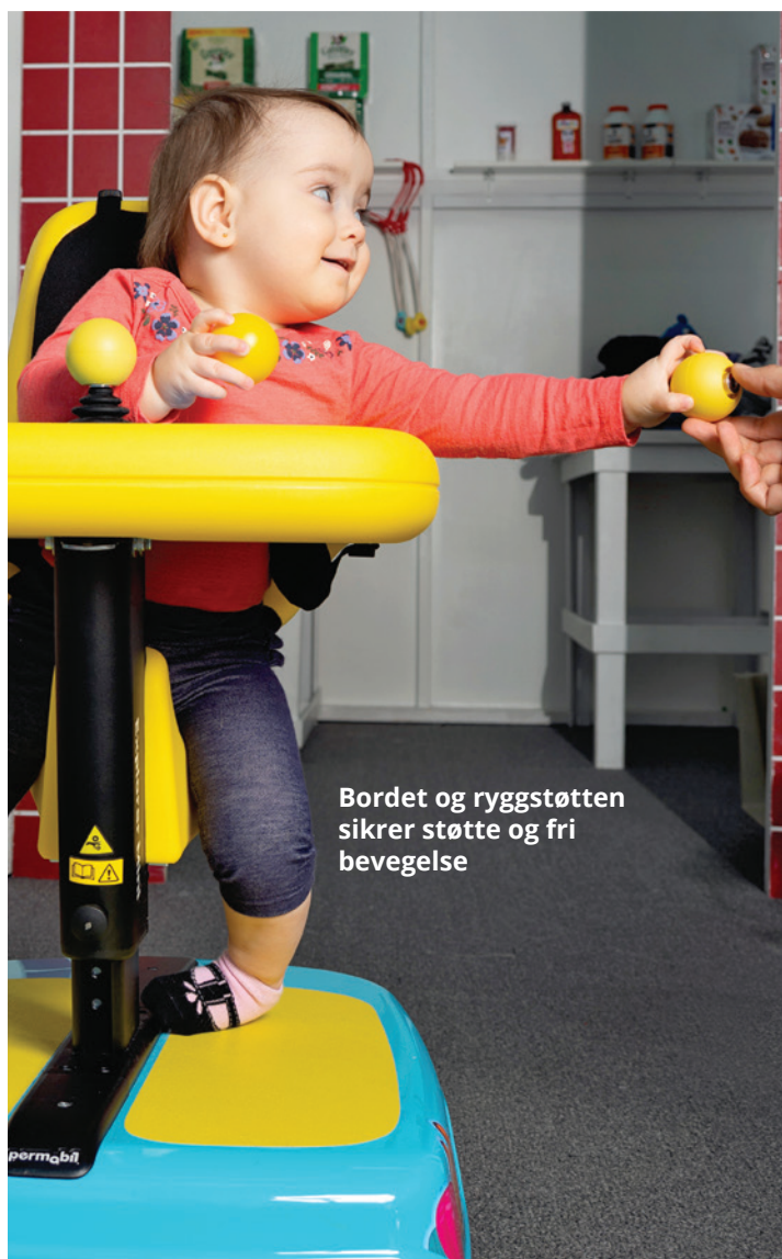
Bordet og ryggstøtten sikrer støtte og fri bevegelse