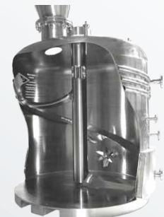
Skrubbandet, armar och axeln kan värmas upp helt.