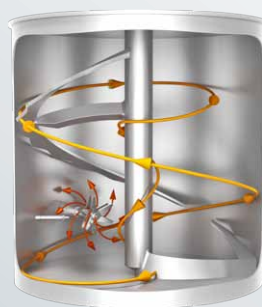
Uppåtgående rörelse i blandningskammarens periferi, nedåtgående rörelse i behållarens centrum