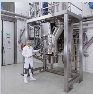
VMT 200 i Alloy 59

Apparaten är trycktät och vakuumtät, kan helt värmas med vatten, ånga eller värmeolja