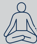
Reducción de estrés