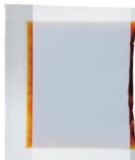
油淋鶏用香味ソース 30g