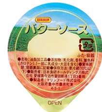
バターソース 7g チルド(1袋)