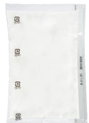
から揚げ用まぶし粉 40g