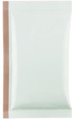
トマト煮込みソース 70g(1袋)

豚肩ロース(230g)、 玉ねぎみじん切り(60g)、 トマト煮込みソース 70g(1袋)、 バターソース 7g チルド(1袋)