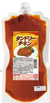
タンドリーチキンオイル 700g