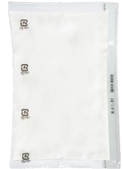
から揚げ用まぶし粉 40g