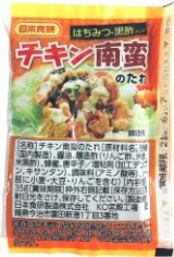
チキン南蛮のたれ 35g

【使用食材】 鶏むね肉 (250g)、 チキン南蛮のたれ 35g (1袋)、 タルタルソース 15g (2袋)、 から揚げ用まぶし粉 40g (1袋)