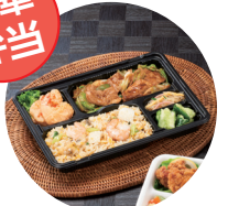
やすらぎ 150-1 B 黒