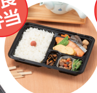
やすらぎ 10-1 B 黒