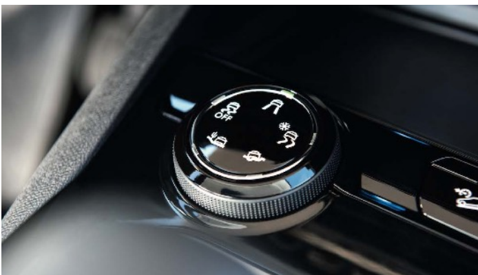
アドバンスドグリップコントロール