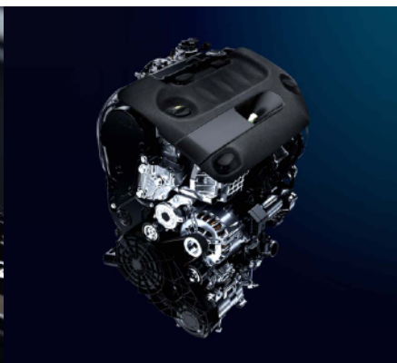
DW10型クリーンディーゼルエンジン