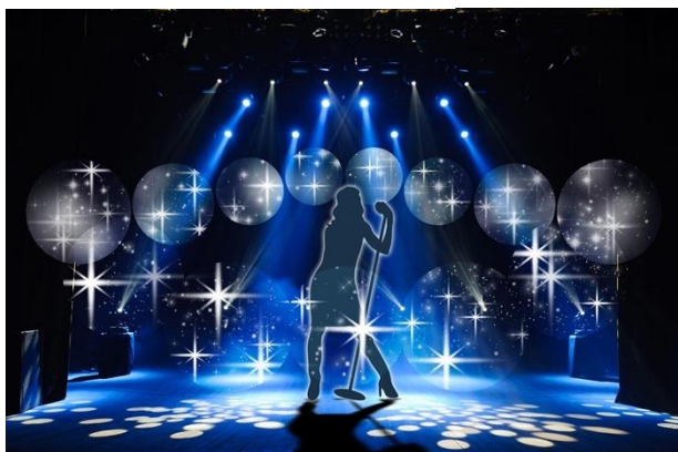
・小・中規模イベントでの利用イメージ