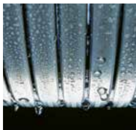
Echangeur de chaleur Inox-radial – durable et efficace

La chaudière murale gaz à condensation Vitodens 050-W offre un confort de chauffage et d'eau chaude sanitaire élevé pour un rapport qualité/prix particulièrement avantageux.