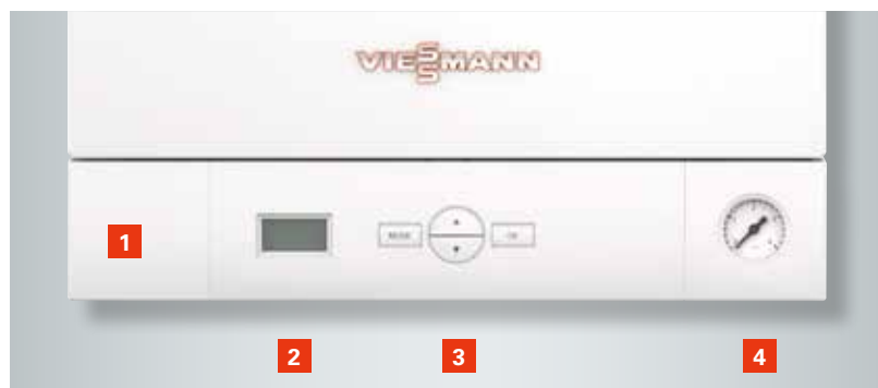
Régulation avec système de diagnostic intégré

Avec ses 707 mm de hauteur uniquement, la Vitodens 050-W est l'une des chaudières murales les plus compactes de sa catégorie. En raison de son faible encombrement, son utilisation est conseillée pour remplacer les anciennes chaudières. Elle est également adaptée pour le raccordement sur une cheminée collective jusqu'à cinq appareils.