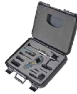
Kit de pochette de transport rigide MMS2

Chaîne de 32°F à 158°F (0°C à 70°C) Précision à 77°F (25°C) +/- 1.3°F (0.7°C)