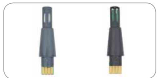
Sonde Hygrostick, référence POL4750, pour les applications fortement exposées à l'humidité.